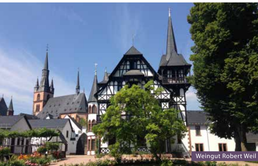
Weingut Robert Weil