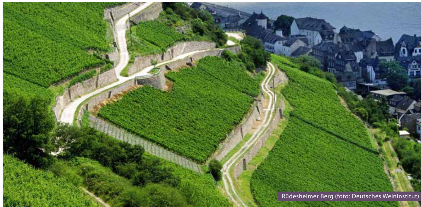
Rüdesheimer Berg

geel fruit, iets tropisch; sterk zoetzuur, spannend, echt 2010, grote lengte (17,5 pnt).