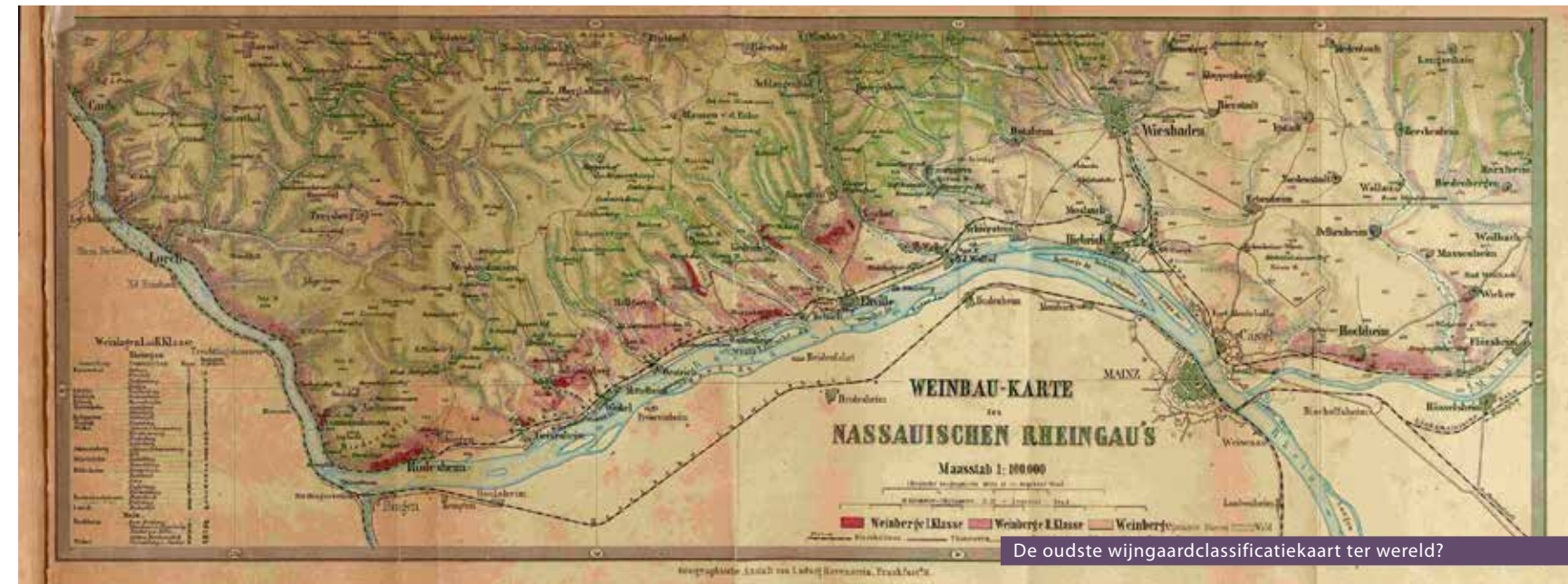
De oudste wijngaardclassificatiekaart ter wereld?

wijngoed, dat zonder twijfel ook tot de mooiste van Duitsland behoort, had de VDP Rheingau een bijzondere proeverij georganiseerd: Der Rheingau und seine prägenden Terroirs . Een uitgelezen mogelijkheid om me te verdiepen in de klassieke Rheingau.