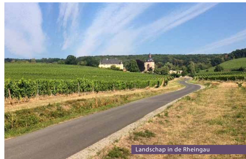
Landschap in de Rheingau